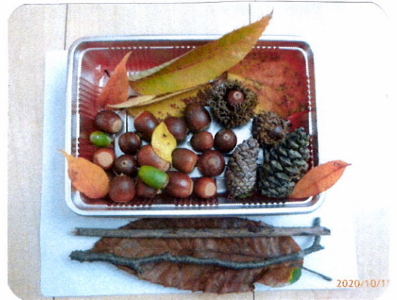
空容器に葉っぱやどんぐりを 入れておままごと

ひろった葉っぱは茶巾拭きなどに3日ほど はさまっておくとまっすぐになり扱いやすくなります