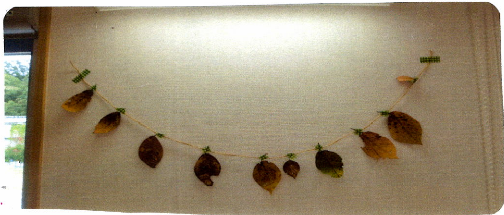
きれいな葉っぱをガランドのように食卓にもステキですね

ひろった葉っぱは茶巾拭きなどに3日ほど はさまっておくとまっすぐになり扱いやすくなります